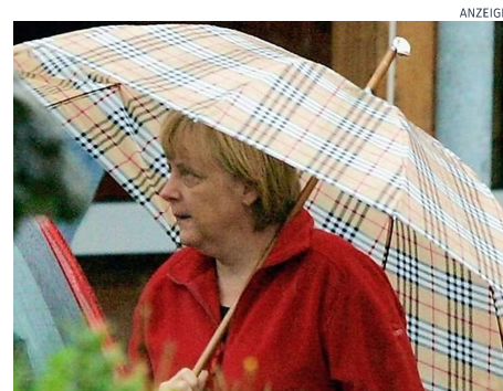
SundayDigest [Fotos] Angela Merkel lebt mit ihrer Familie in diesem Traumhaus