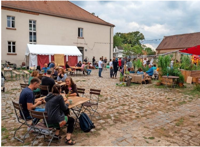
Der Gutshof Klein Glien ist das Herzstück und Mittelpunkt des Kreativcamps der dritten Sause.

Fernab der schnellen digitalen Welt stehen etwa Musik, Naturkosmetik, der Bau kirgisischer Jurten, traditioneller Blaudruck, Wildnis-Pädagogik, Stressbewältigung, Wellness und eine Traumwerkstatt auf dem Programm. Wer Handgemachtes dem Elektronischen vorzieht und dem Smartphone für einige Stunden den Rücken kehren möchte, dem bietet sich hier die Gelegenheit.